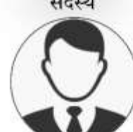
छवि लाल गुरुङ्ग सदस्य