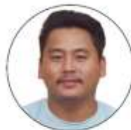
जीवन भुलेल अल्पसंख्यक सदस्य