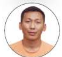
निर काजी आले सदस्य